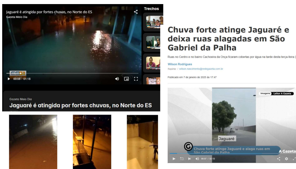
Figura 3 - Alagamentos e enchentes no município.

No campo da infraestrutura, persistem problemas recorrentes de inundações e alagamentos durante os períodos chuvosos (Figura 3), reflexo da insuficiência crônica do sistema de drenagem pluvial. As chuvas intensas expõem a ausência de obras estruturantes de macrodrenagem e a urgência de um plano diretor de drenagem atualizado e efetivo. Nas áreas rurais, a precariedade das estradas vicinais compromete o transporte e o escoamento da produção agrícola (DER-ES, 2024), acentuando as desigualdades e limitando a integração urbana-rural.