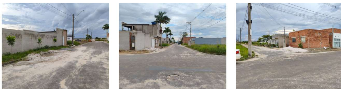
Figura 4 - Bairro Eldorado, Jaguaré/ES

No ordenamento territorial, Jaguaré carece de um sistema consolidado e plenamente aplicável. Embora exista legislação voltada à arborização e às áreas verdes, sua efetividade é limitada pela falta de regulamentação e fiscalização. O não cumprimento integral do Plano Diretor Municipal favorece a expansão urbana desordenada, a ocupação irregular, a permanência de vazios urbanos (Figura 4) e o agravamento da degradação ambiental. Soma-se a isso um déficit habitacional expressivo, associado ao crescimento populacional e à carência de infraestrutura básica em áreas periféricas, especialmente no que se refere a saneamento e energia.